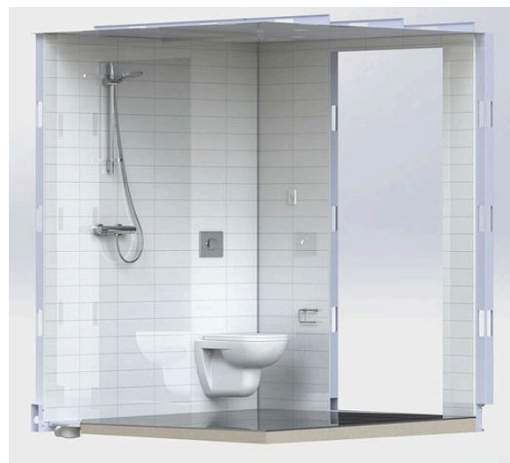
Fig. 1 Badekabine GreenBox One leveres komplett med flislagte overflater og ferdig montert sanitærutstyr

Sluket er plassert i hjørnet mot vegg i dusjsone. Sluk skal monteres i samsvar med tettesjiktets monteringsanvisning, se fig. 2.